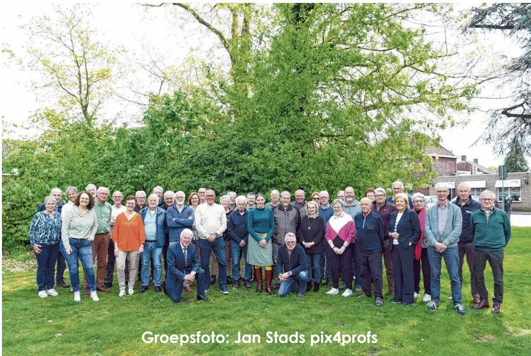
Groepsfoto: Jan Stads pix4profs